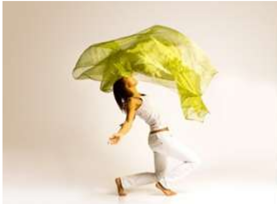
Kreativität Bewegung Tanz Beweglichkeit