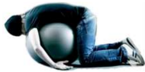
Bewegungsgestaltung in der Schule

Somit beschäftigte sich eine weitere Veranstaltung mit diesem Thema.